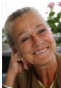
af Ritt Bjerregaard

Spidskandidat for Social- demokraterne i København