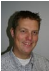
af Jan Salling