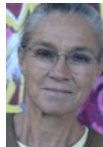
af Ritt Bjerregaard

Det er nogle af de værdier, jeg vil arbejde ud fra, hvis jeg bliver spidskandidat. Og så vil jeg glæde mig til at formulere et valgprogram og diskutere byens fremtid sammen med de socialdemokratiske medlemmer i København.