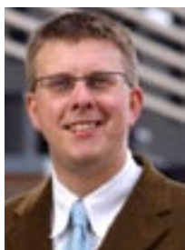
af Bo Sandberg

Formand for Social- demokraterne i København